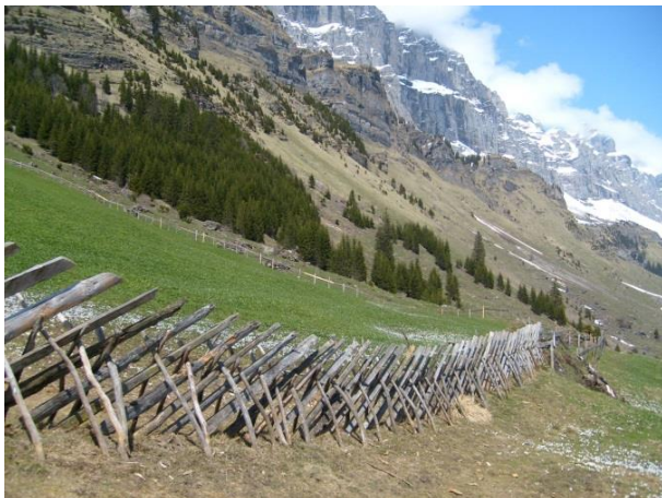
Traditioneller Schärhag im Urner Berggebiet