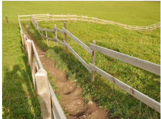
Traditioneller Lattenzaun im Wirzweli