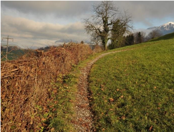
Lebhag entlang Wanderweg